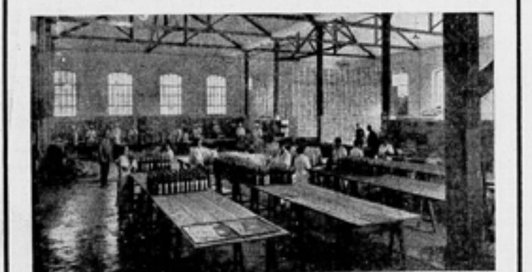
FABRICA CINZANO - CONFECCIONAMENTO E ENCAIXOTAMENTO A fabrica Cinzano possui tanques e tonéis para uma capacidade de 1.600.000 litros. Apparelhada para engrafar e encaixotar 60.000 litros por dia ou sejam 150.000 caixas por anno, poderá produzir - com pequenos aumentos - 300.000 caixas. A fabrica Cinzano usa exclusivamente garrafas e caixas novas. As garrafas são lavadas com agua purissima de agua tubular de grande profundidade. O consumo annual da fabrica Cinzano é de cerca 1.000.000 de litros de vinhos nacionais das melhores procedencias.