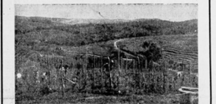
FAZENDA CINZANO - UMA VISTA DAS NOVAS PLANTAÇÕES Na pittoresca municipalidade de São Roque, no E. F. Sorocabana, a Cinzano S/A possui uma fazenda viti-vinicola modernissima onde já ferem plantadas 100 mil videiras das mais finas castas e iniciada a construção de uma grande cantina que terá a capacidade de preparar 1.000.000 de litros de vinho por anno. Dirigida por um tecnico de mais alta competencia, a fazenda de Cinzano terá dentro em breve mais de mil videiras.