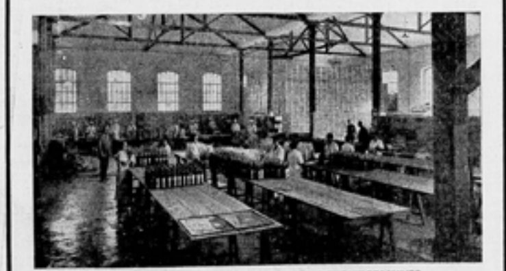
FABRICA CINZANO - CONFECCIONAMENTO E ENCAIXOTAMENTO. A fabrica Cinzano possui tanques e toneis para uma capacidade de 1.600.000 litros. Apparelhada para engarrafar e encaixotar 60.000 litros por dia ou sejam 150.000 caixas por anno, poderá produzir - com pequenos aumentos - 300.000 caixas. A fabrica Cinzano usa exclusivamente garrafas e caixas novas. As garrafas são lavadas com agua purissima de agua tubular de grande profundidade. O consumo annual da fabrica Cinzano é de cerca 1.000.000 de litros de vinhos nacionais das melhores procedencias.